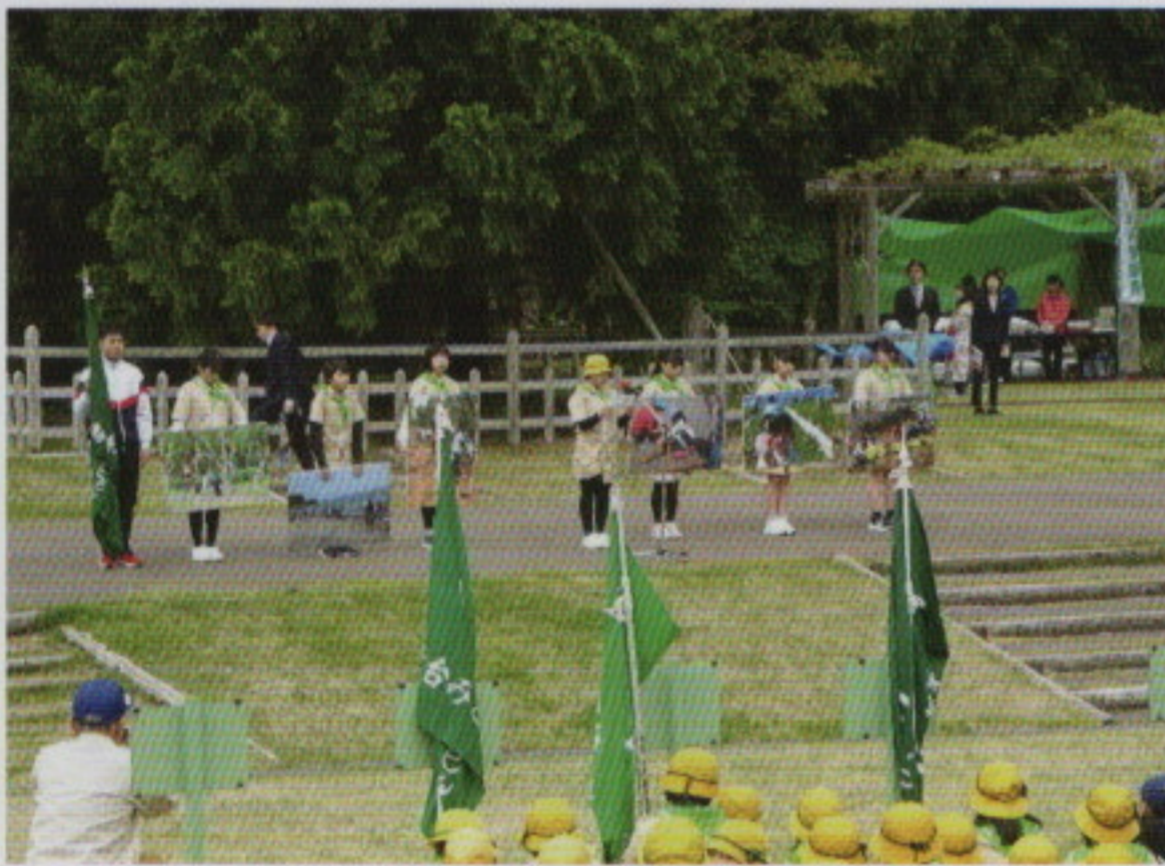
緑の少年団の活動支援