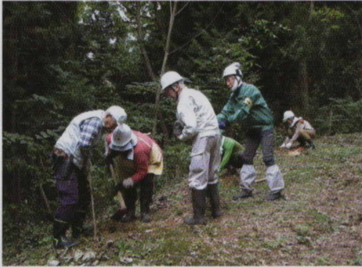
森林ボランティアによる森林整備活動