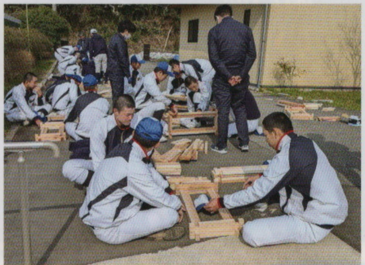
被災地の環境緑化のためのプランター製作