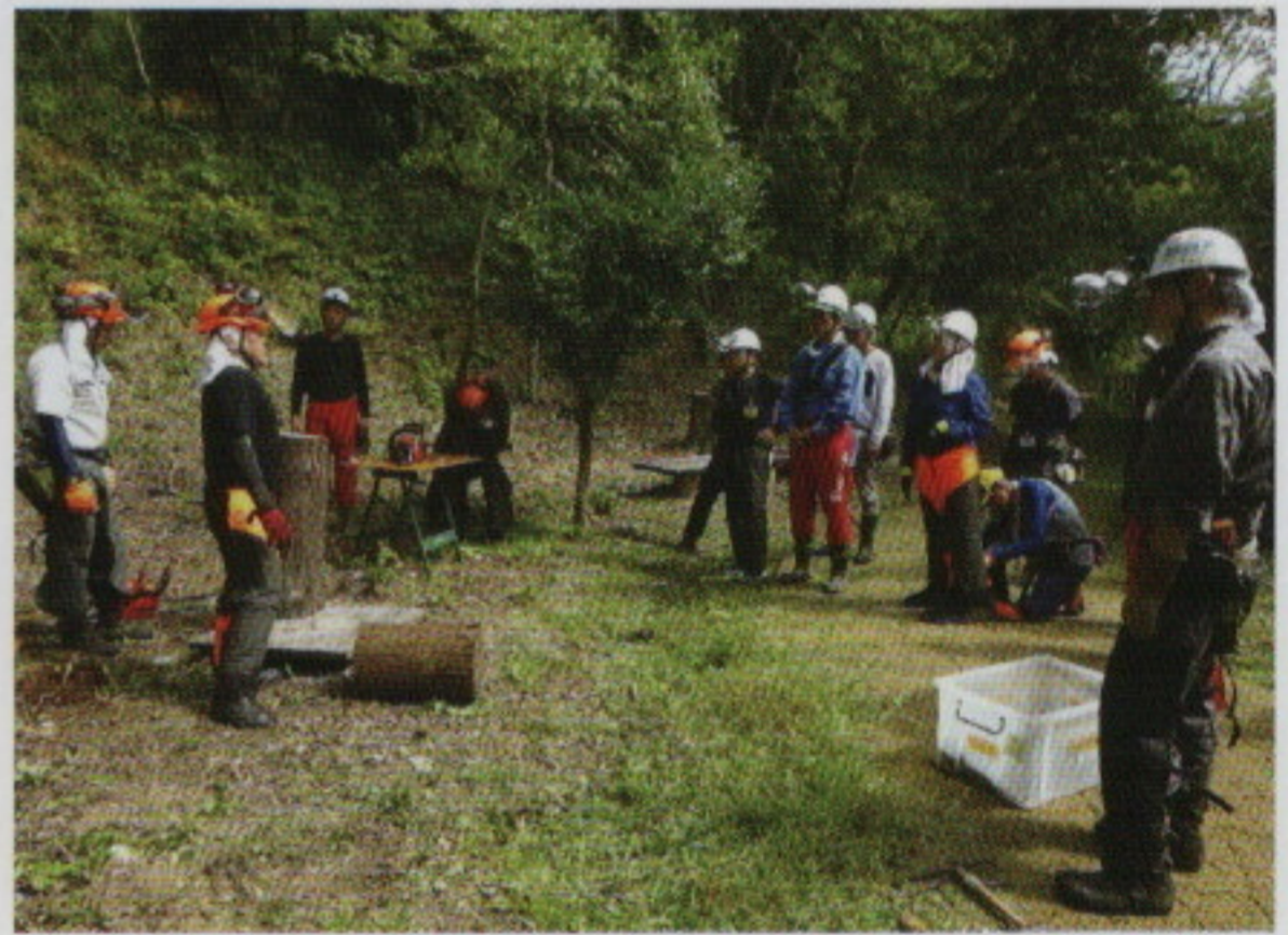
森林ボランティアの養成