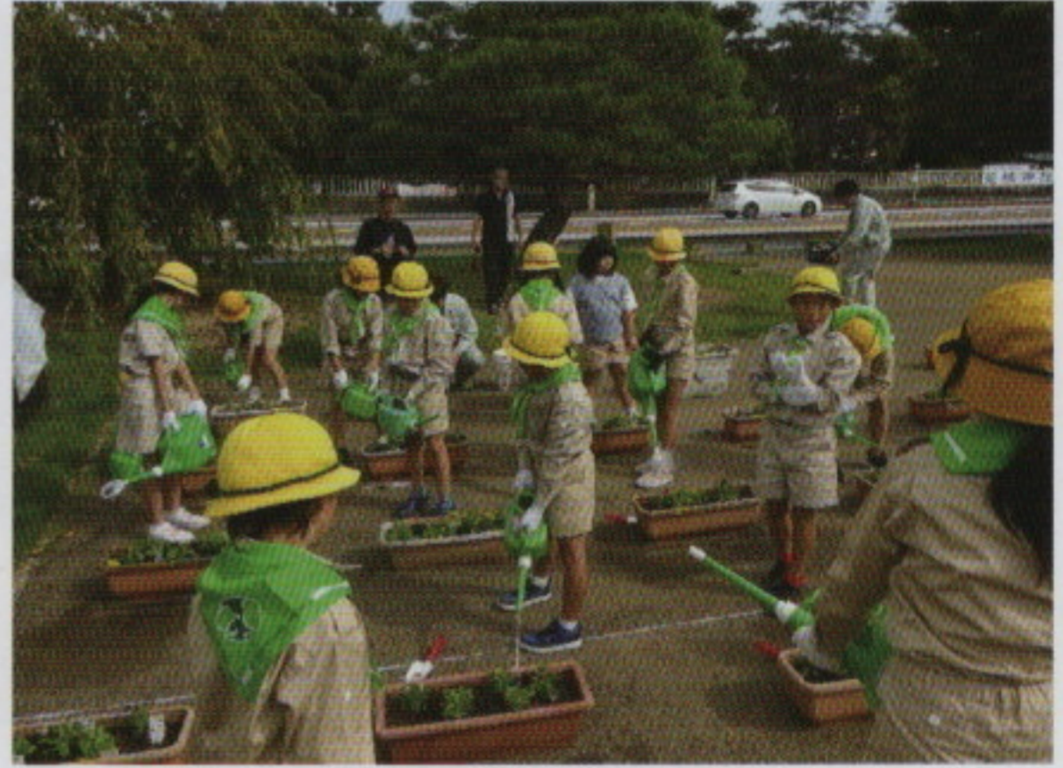
学校での緑化活動