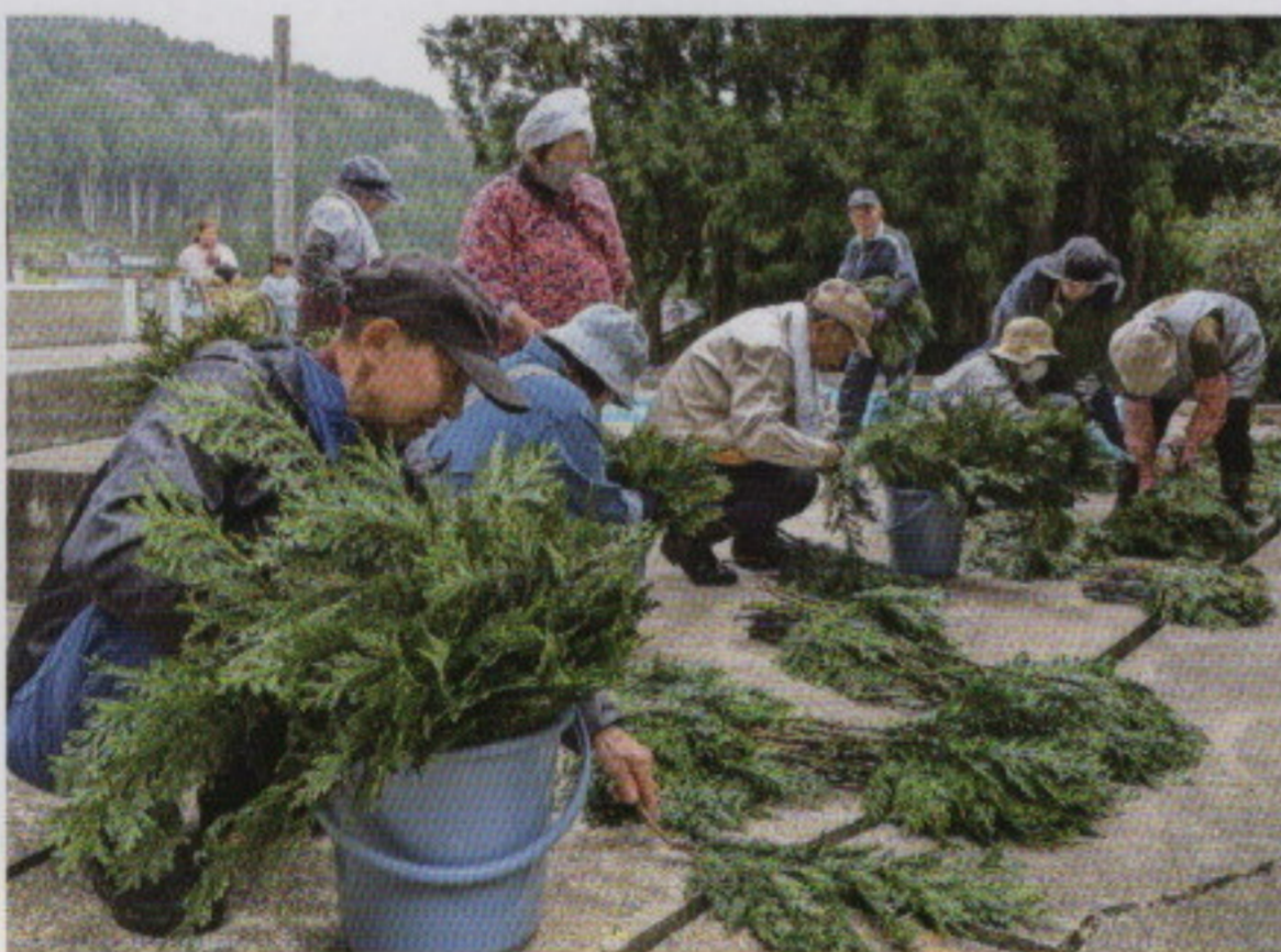
能登半島地震被災地住民による苗木生産を支援